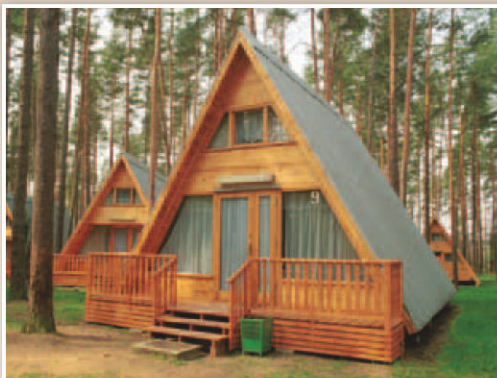
Ośrodek Wczasowy „LEŚNE USTRONIE” Zamrzenica 10, 89-510 Bysław

położony w Zamrzenicy - małej osadzie leżącej w sercu Borów Tucholskich, 18 km na południe od Tucholi, bezpośrednio nad brzegiem Jeziora Koronowskiego. Obozowicze zakwaterowani będą w drewnianych domkach campingowych 6 - 7 osobowych typu „Brdą” oraz 3 - 4 osobowych typu „Chata” usytuowanych na 5,5 hektarowym terenie, w suchym, sosnowym lesie, w dolinie rzeki Brdy. Wszystkie domki posiadają łazienki (umywalka, natrysk, WC) i aneks kuchenny z chłodziarką i podstawowym wyposażeniem kuchennym. Uczestnicy obozów „Za Linią Wroga”, „Sztuka Przetrwania” i „Leśna Potyczka” zakwaterowani będą w domkach lub w wojskowych namiotach 10 osobowych (po 4 - 8 osób w namiocie) wyposażonych w wojskowe, składane łóżka wraz z materacami i kocami, szafki na ubrania i wieszaki. Nieopodal namiotów niezależne zaplecze sanitarne. Do dyspozycji uczestników: jadalnia, kawiarnia z salą dyskotekową i słonecznym tarasem, świetlica z telewizorem, sklepik spożywczy, tenis stołowy, boisko do siatkówki plażowej, piłki nożnej, koszykówki, plac zabaw, miejsce na ognisko, pole militarno-taktyczne z fortyfikacjami, mini park linowy, sprzęt sportowy i wodny, własna, wydzielona plaża z pomostami i wojskowy tor przeszkód.